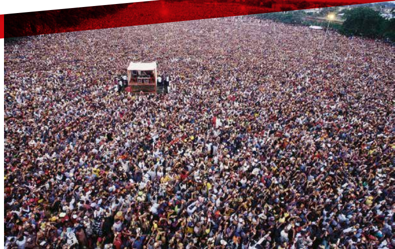
Benin City, Nigéria

Exactement 25 ans après avoir commencé le ministère le 6 décembre 1974, du 7 au 12 décembre 1999, 525 000 personnes assistèrent à une seule réunion à Port Harcourt (Nigéria). Pendant les six jours de la campagne d'évangélisation, plus de 2,1 millions de personnes vinrent assister aux réunions et plus de 1,1 million acceptèrent Jésus Christ comme leur Sauveur personnel. Quel grand anniversaire !