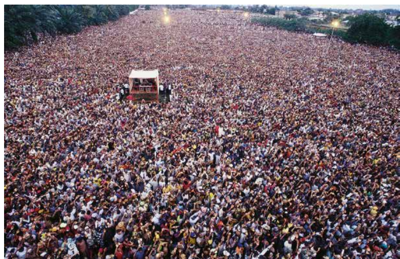
Benin City, Nigérie