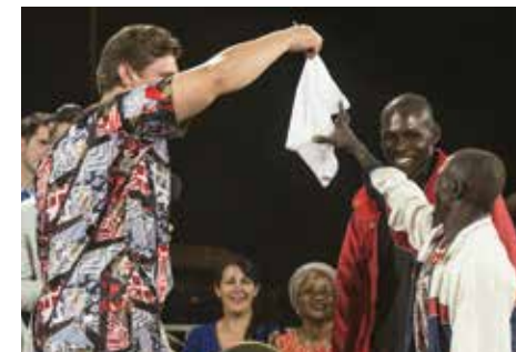
Cet homme, aveugle des deux yeux depuis trois ans, recouvra la vue.

Les réunions furent diffusées en live sur deux stations de radios dans toute la région. Comme la majorité de la population est musulmane, beaucoup ne purent venir assister sur place aux réunions mais purent entendre l'Évangile à la radio. Les radios nous dirent qu'elles furent submergées par des appels de leur audience ! Ceux qui appelèrent rapportèrent de merveilleuses guérisons ainsi que des nouvelles conversions à Jésus.