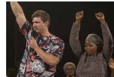
Cette femme témoigna qu'elle avait eu une tumeur à la poitrine qui disparut immédiatement pendant la prière ainsi que toutes les douleurs.

Les réunions furent diffusées en live sur deux stations de radios dans toute la région. Comme la majorité de la population est musulmane, beaucoup ne purent venir assister sur place aux réunions mais purent entendre l'Évangile à la radio. Les radios nous dirent qu'elles furent submergées par des appels de leur audience ! Ceux qui appelèrent rapportèrent de merveilleuses guérisons ainsi que des nouvelles conversions à Jésus.